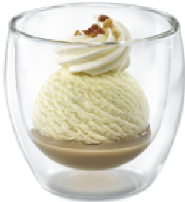
VANILLE AU BAILEYS 2cl Baileys in harmonischer Verbindung mit einer Kugel Vanille-Rahmglace CHF 9.00