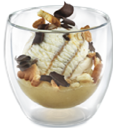
WILHELM TELL Eine Kugel Vanille & Caramel salé-Rahmglace, Apfelmus, Petit-Beurre und Schokoladenspäne CHF 9.00